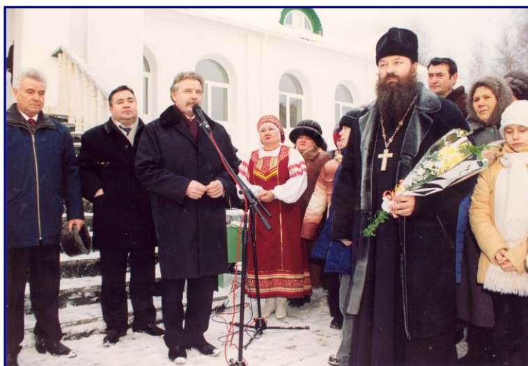
17 января 2005 года открытие Воскресной школы.