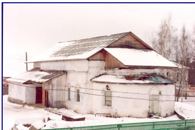
Сохранившееся здание храма Вознесения Господня