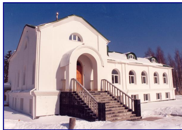
Воскресная школа п. Горноправдинск