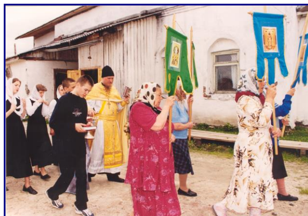
Крестный ход вокруг здания Вознесенской церкви и строящейся Воскресной школы