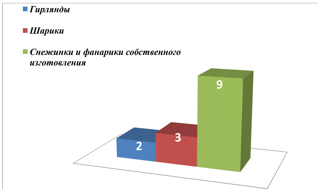
Рисунок 1, 2.